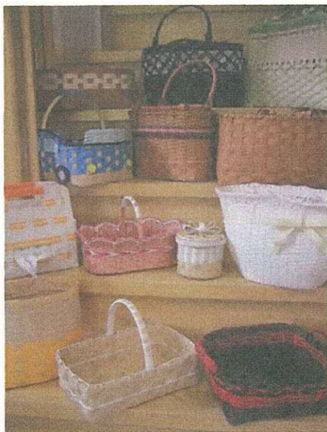
実用的なかご～バッグ

はじめての方、ぶきっちょさんでも大丈夫です 今まで、小学生から、70代の方まで教えてきました 皆さん、自分の作品ができましたよ