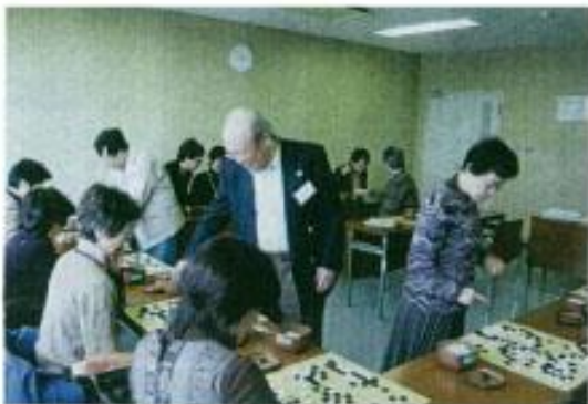
女性のための囲碁遊芸