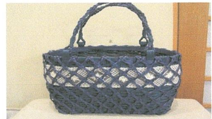
違い四つ目バッグ