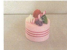
ケーキの小物入れ